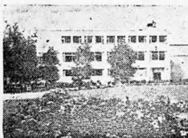
PARKRESTAURANTEN A/S - PORSGRUNN