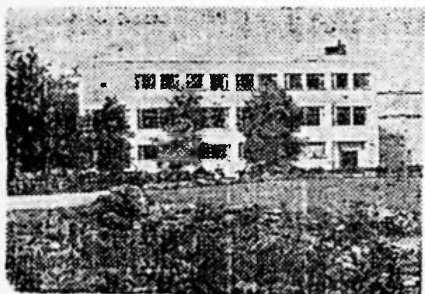
PARKRESTAURANTEN A/S PORSGRUNN