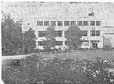
PARKRESTAURANTEN A/S · PORSGRUNN