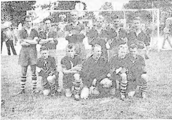
A laget som slo Jerv, Grimstad 4-1 i 2. runde.