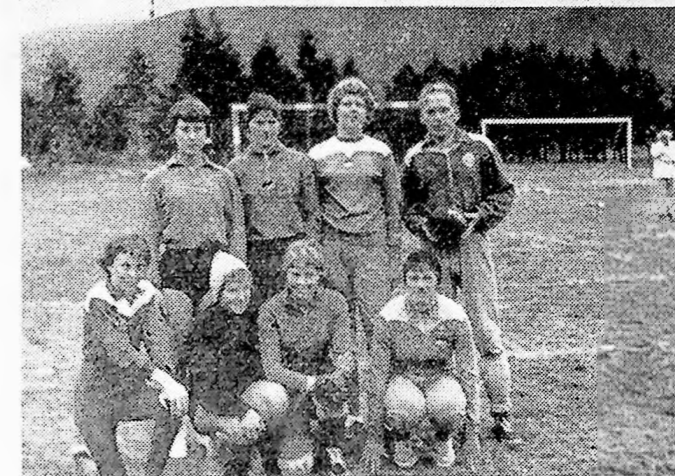
Pikelaget (med reiselederen) som spilte mot Skarphedin i Seljord i pinsen.

Nu som håndballserien er halv-spilt og en tar en titt på resultatene, må en si at spillerne har gjort det overraskende godt.