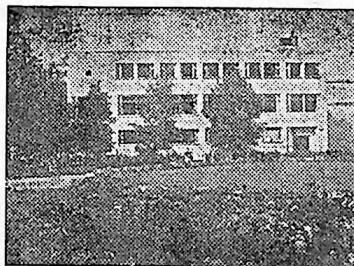
PARKRESTAURANTEN A/S PORSGRUNN