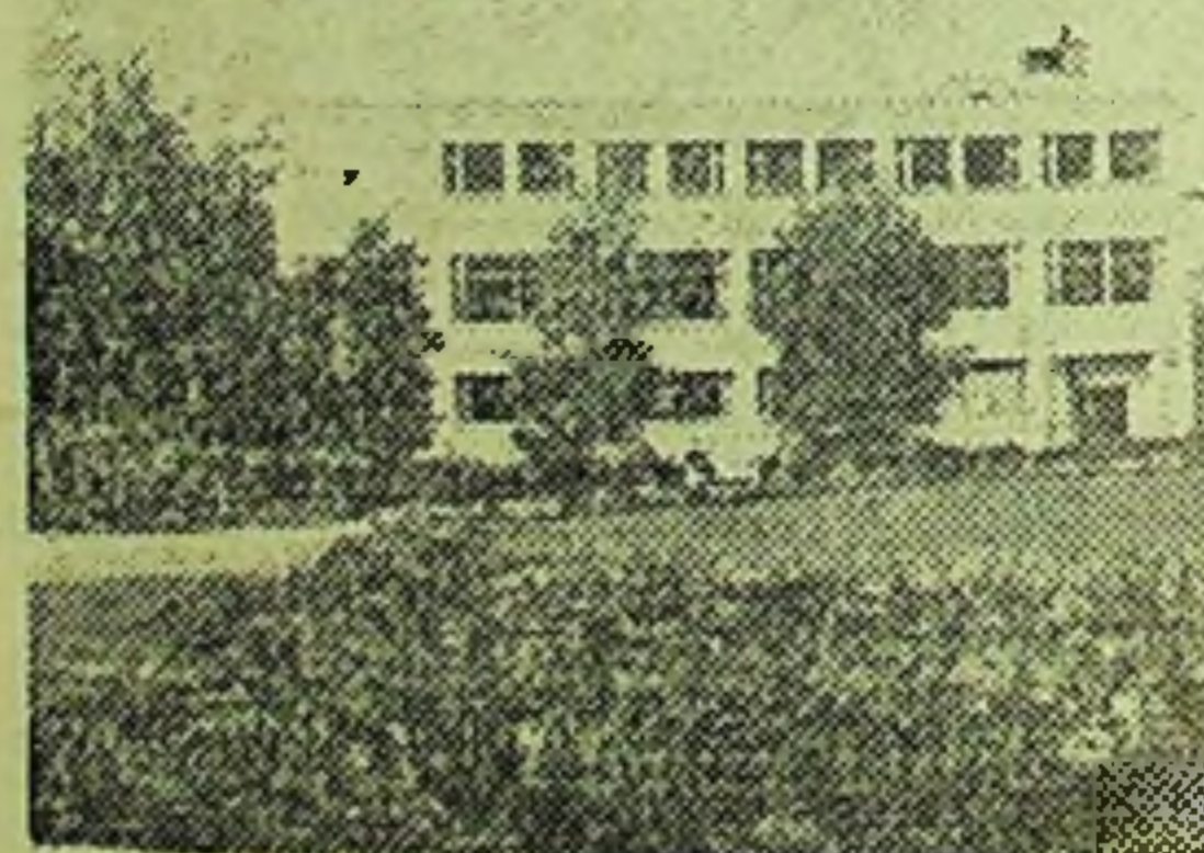
PARKRESTAURANTEN A/S PORSGRUNN

Blomster for alle anledninger i inn og Friske grønnsaker hele året Bukett- og kransebinderi Telf. 5 13 56 — Vestsiden Medlem av Norsk Blomstertelegrafisk Forening