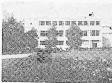
PARKRESTAURANTEN A/S PORSGRUNN