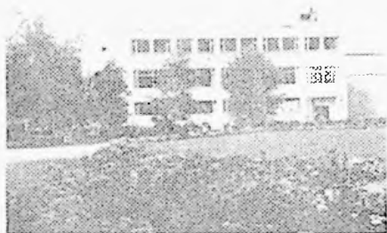
PARKRESTAURANTEN A/S PORSGRUNN