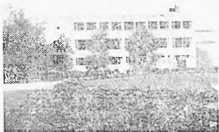
PARKRESTAURANTEN A/S PORSGRUNN