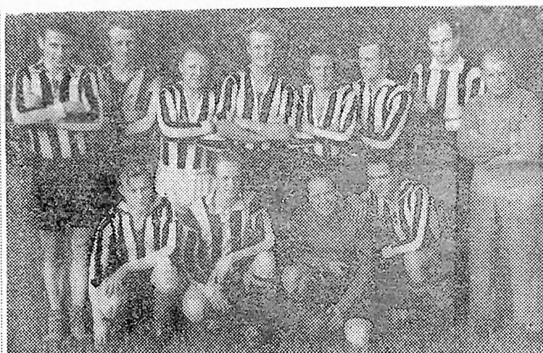
B, 03's lag.

Boldklubben 1903, København, som i dag spiller mot et forsterket Porslag, har i all tid vært en av Danmarks framste fotballklubber og har stadig forstatt å hevde seg i Danmarksmesterskapet. Dessuten har klubben gitt mange spillere til det danske landslaget. Senest i fjor knep laget mesterskapet foran bade B 93 og Akademisk Boldklubb.